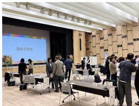
<R6 事業者交流会の様子>