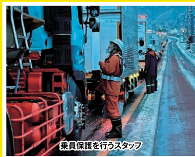
令和7年3月 山梨県内国道20号における 車両滞留の発生状況