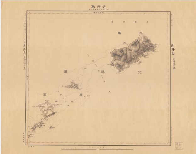
「明治25年 1/20万 色丹島」 （陸地測量部）