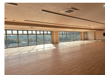
● リハビリテーションセンター