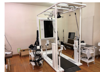
● リハビリ支援ロボット ウェルウォークWW-2000 岐阜県内初導入