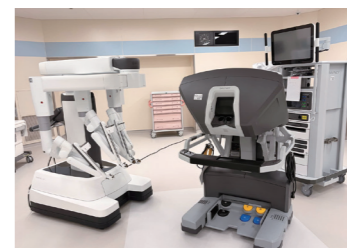
● 手術支援ロボット ダヴィンチ