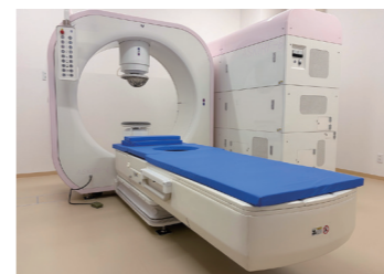
● 高周波式がん温熱治療装置 ハイパーサーミア アウクーフ8