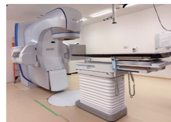
● 放射線治療 バリアンEdge