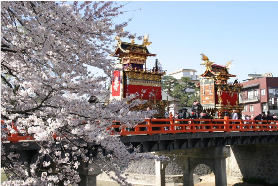
春の高山祭（桜と祭屋台・高山市）

本所 〒506-8688 岐阜県高山市上岡本町7丁目468番地 電話 0577-33-1111（代表） 下呂支所 〒509-2592 岐阜県下呂市萩原町羽根2605番地1 電話 0576-52-3111（代表） https://www.pref.gifu.lg.jp/soshiki/20509/