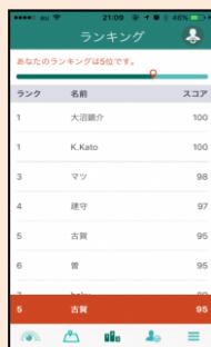
スコアランキング