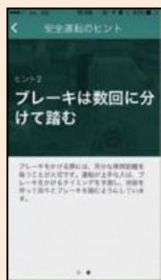
安全運転のヒント