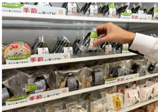
食ロス防止「てまえどり」のポップ