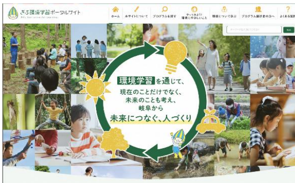
ぎふ環境学習ポータルサイト