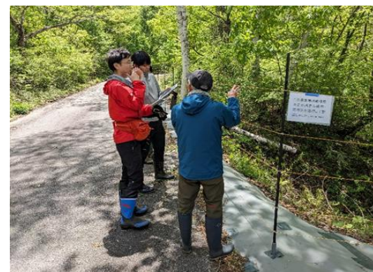
鳥獣害対策に関する技術指導の実施