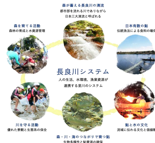
「長良川システム」の概要