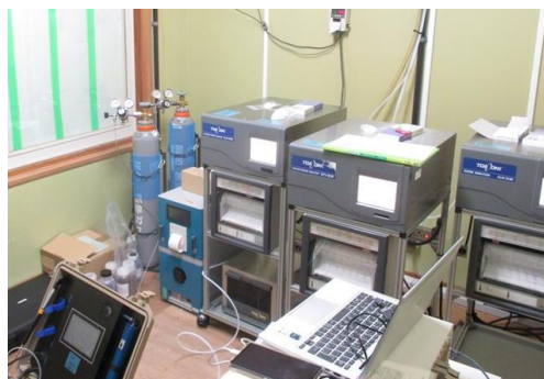
大気環境モニタリング