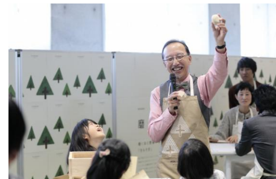
環境教育推進員による講義風景