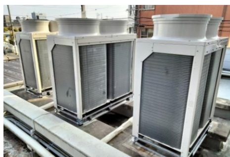
省エネ診断による機器の更新