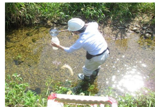
水質調査の実施風景