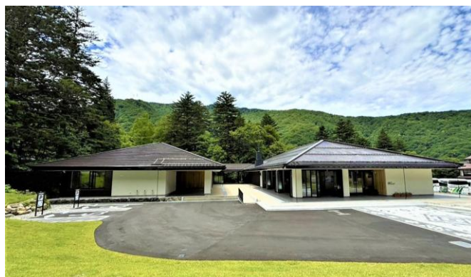
中部山岳国立公園 奥飛騨ビジターセンター