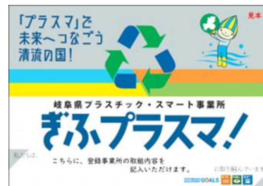
ぎふプラスマ!登録店ステッカー