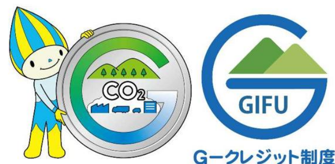
県独自の森林由来の カーボンクレジット制度