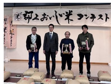
【米コンテストで 表彰された方々】

農業普及課では、運営メンバーとして企画から支援しており、今後も郡上産の美味しい米づくりを推進していく。