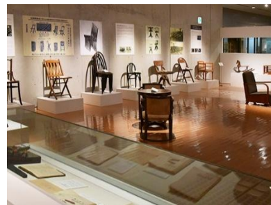
ミュージアム飛騨