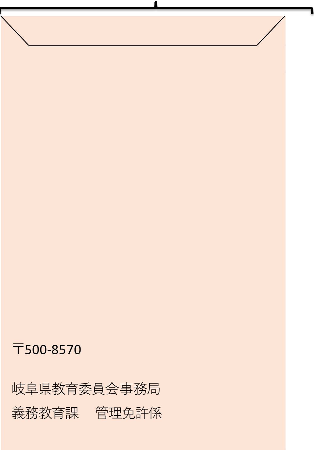
角形2号（A4を折らずに送付できる大きさ）