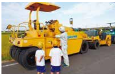
地元小学生を招いての建設重機乗車体験。

ほかにも吉川組では、地域貢献活動にも力を入れており、近隣の小学校や保育園に通う子どもたちにも、工事現場で見ることのできる重機に触れたり、建設の仕事に興味を持つってもらう機会を設けている。