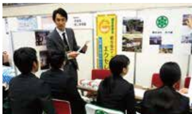
大学生を対象とした就活フェアに参加。

育児や介護、社員の健康状態などに配慮し短時間勤務制度も取り入れている。小学生の子どもを持つ40代女性社員は週3日勤務に時短勤務を併用し、子どもを学校に送り出した後に出勤。学校行事にも参加しながら重要な財務関連の業務を長年にわたり続けている。また、定年制度を設けていないため、勤続年数が20年〜40年のベテラ