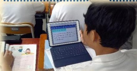
【写真】どのアドバイス例がよいかペアで話し合っている様子

【Advice for Shin③】 You must finish your shower in ten minutes because you are a member of the family. So why don't you wash your hair and body at the same time?