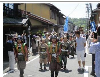
←光秀まつり参加の様子