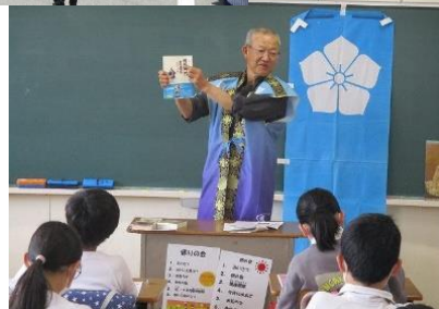
光秀について地域講師の授業 →