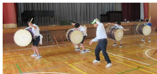
委員会の時間における「伝統づくり委員会」の児童たちの表佐太鼓踊りの練習の様子

表佐祭りの時に、「伝統づくり委員会」の児童や有志の児童が、大人と一緒に「表佐太鼓踊り」を演じています。また、表佐地区の文化祭で、「表佐太鼓踊り」を披露しています。「伝統づくり委員会」の児童の中には、「大人になったら大きな太鼓で踊りたい。」という願いをもっている児童もいます。少子化の中、地域の無形文化財の伝承の礎作りの取組です。