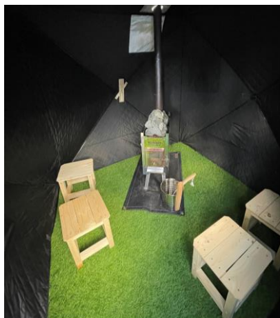
テントサウナ内部の様子

◎ オーナーは「民泊おりべ」の他にも複数の民泊住宅を運営されています。もともと所有していた空き家物件を利用されていることもあり、ホテル等のように立地を選ばない条件もある中で、宿としての「特徴」を演出する等、工夫次第で色々な方に利用していただけるというお話が印象的でした。