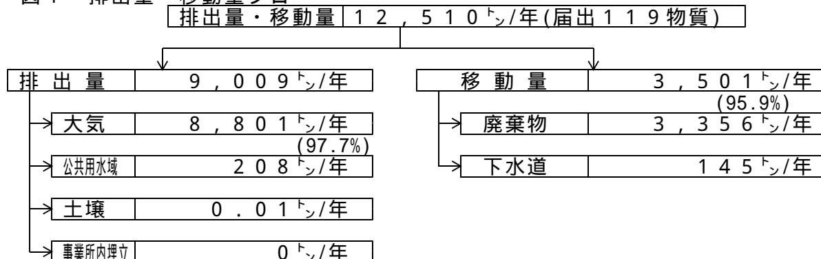
図1 排出量・移動量フロー