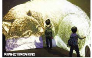
空間投影×アニメーション(東京藝術大学) 投影されたアニメーションが人の動きに合わせて、目を覚ましたり、目で追ったりする、プロジェクションマッピング。

第39回国民文化祭 第24回全国障害者芸術・文化祭 「清流の国ぎふ」文化祭2024 ともに・つなぐ・みらいへ ~清流文化の創造~ 2024年10月14日(月・祝)~11月24日(日)