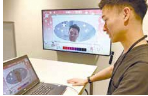
笑顔測定(NEC) カメラに映った人物の「笑顔度」をスコアで測定。