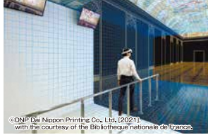
みどころウォーク(大日本印刷) 手すりをたどりながら実際に移動することでVR空間内を動き回ることができる鑑賞システム。