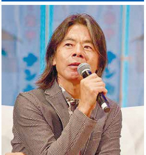
「清流の国ぎふ」文化祭2024 総合プロデューサー 東京藝術大学学長 日比野 克彦氏