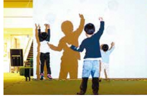
Bubbles(東京藝術大学) 自分の影の動きで投影された映像(シャボン玉)を動かすことができる、ハイブリット影遊びの参加型メディアアート。