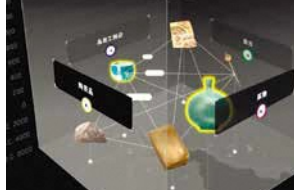
みどころキューブ(大日本印刷) 文化財・芸術作品などについて、キューブ(立方体)状のインタフェースの中に配置し、テーマ関連性など多様な視点から紹介できる鑑賞システム。