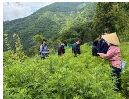
いび薬草の里プロジェクト