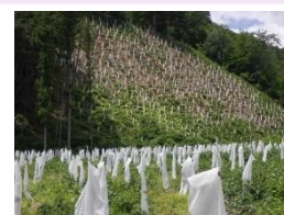
森林整備事業 (植栽)