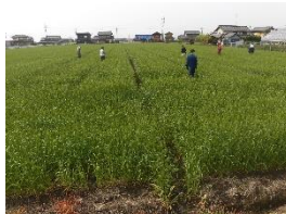
小麦種子ほ場審査