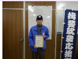
担い手証書交付式