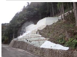
山地災害 災害関連緊急治山事業