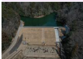
ため池の耐震・豪雨対策