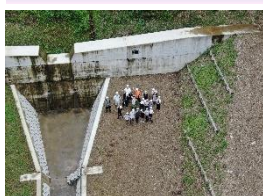
治山事業PR (学校教育)