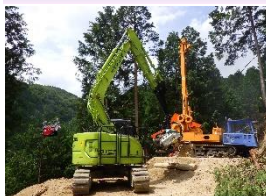
森林整備事業 (木材生産)