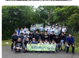
企業の森づくり活動(平和堂)