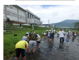
緑と水の子ども会議(八幡小)