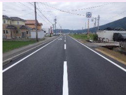
農道施設強化 農道舗装