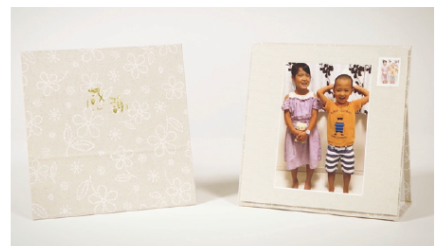
印刷コード埋込技術を活用した写真台紙