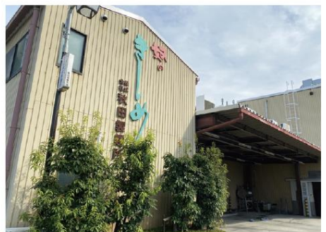
株式会社秋田製麺所の外観