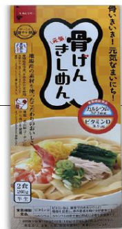
栄養機能食品技術を含む商品

株式会社秋田製麺所は、きしめん、やきそば等を製造販売する中小企業です。「ほかにはない特徴のある自社商品を作りたい」と、愛知県で開催された知財ビジネスマッチングイベントに参加しました。そこで、自社の製麺技術とアークレイ株式会社の温州みかんを原料とした「クリプトベータ™」を合わせることで、今までにない商品が作れると考えました。麺と機能的に相性が悪い柑橘系の素材ですが、試行錯誤の末、自社技術でクリアしました。シーズ技術を活用し、ビタミンD、カルシウムを含む特色ある商品を開発したことにより、これまで関心を示さなかった企業からも興味を持たれるようになり、販路拡大に効果がありました。現在は、支援機関の助けを借りながら、販売網を広げているところです。