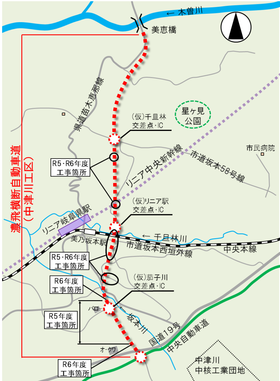
工事期間を必要とする範囲（駅南地区）を中心に事業を進めています