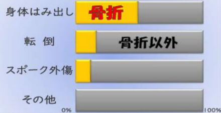
図. 事故の原因と骨折の割合(n=207) 医療機関ネットワーク情報より

身体のはみ出しによる事故の半数は 骨折！ 人の骨の中で最も大きい 大腿骨 を骨折する事故が発生