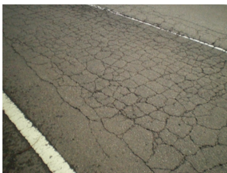
(主)恵那白川線 (白川町切井)