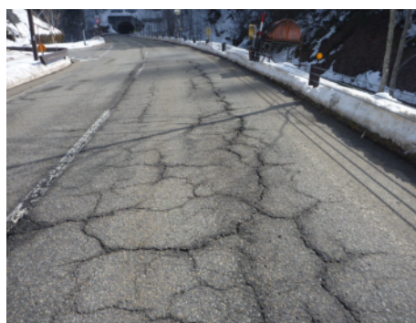
(国)471号 (高山市奥飛騨温泉郷平湯)

(款)11災害復旧費 (項)2土木施設災害復旧費 (目)(1)土木施設災害復旧費 (明細書事業名) 公共事業 道路橋りょう災害復旧費