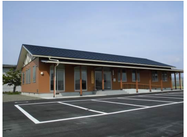
就農支援センター 事務・研修棟