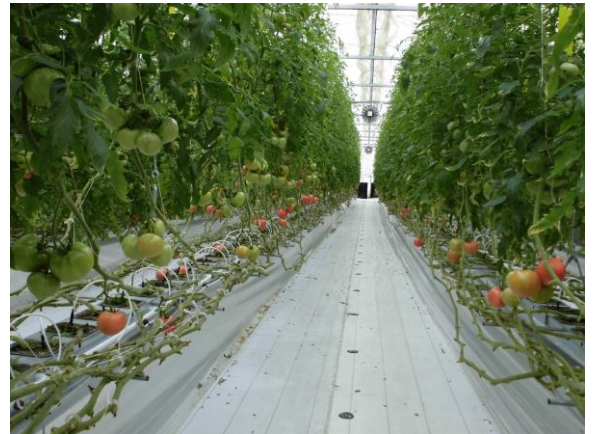
就農支援センター 研修ハウスの様子