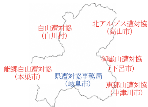
[山岳遭難（防止）対策協議会]

県内の主要な5つの山系には、山岳遭難防止と遭難者の捜索・救助を目的に、山岳救助隊を擁する民間団体の山岳遭難（防止）対策協議会が組織され活動している。