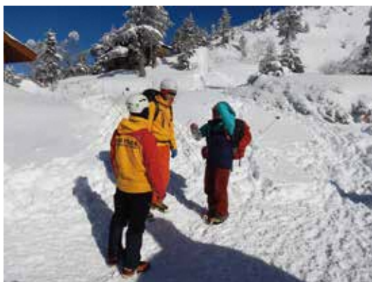
北アルプスにおける安全指導活動