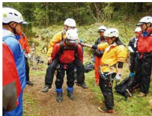
山岳警備隊員と消防署との合同訓練