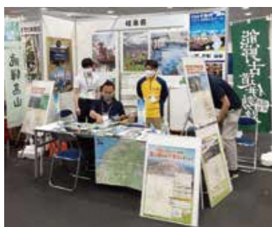
夏山フェスタ広報

入山直前でも登山届を提出できるように、北アルプス等の各登山口に、登(下)山届ポストを設置している。