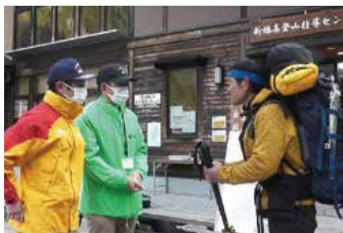
安全指導活動（新穂高）

また、金華山、鳩吹山など、いわゆる低山と呼ばれる身近な山においても、登山者への安全登山広報や登山道における危険箇所点検を実施した。