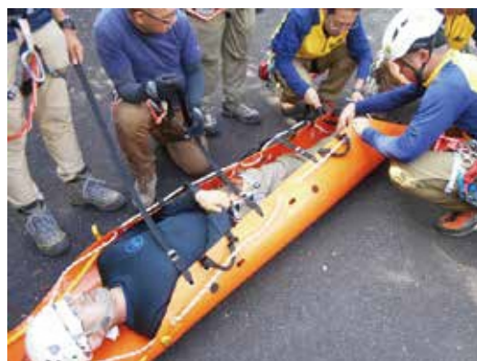
ストレッチャー搬送訓練