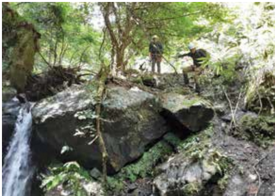
行方不明者捜索活動