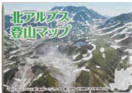
北アルプス登山マップ