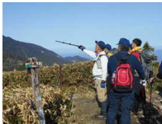
恵那山におけるパトロール活動