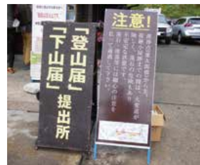
登(下)山届提出案内