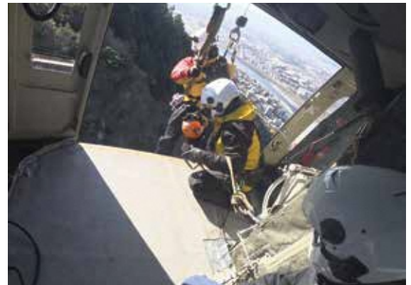
ヘリによる救助活動