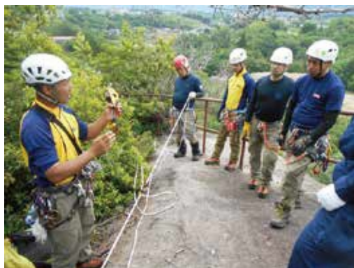
岩場における基本訓練