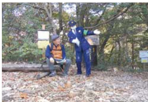
安全指導活動（金華山）