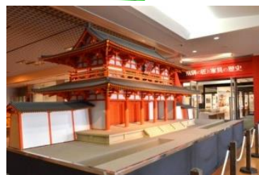
平城宮朱雀門1/10模型

「日本の美 飛騨デザイン」をコンセプトに、モノ作りの聖地である飛騨地域から、優れたデザイン性を有する岐阜県の製品・商品、また、古代から現代に連なる飛騨の匠の技とその歴史を、高山を訪れる全国・世界の方々に向けて情報発信・紹介します。