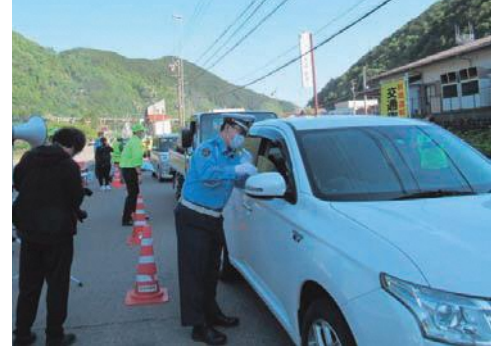
交通指導所の開設