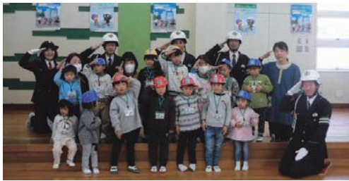
明宝保育園ちびっこカリメロ隊