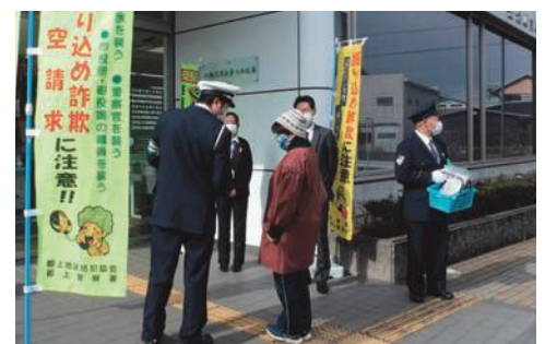
年金支給日における詐欺防止広報活動