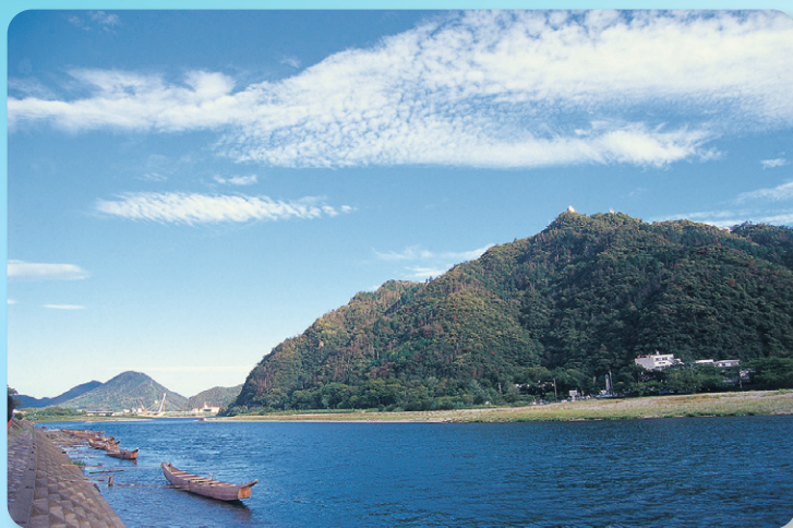
◆サステイナブル・ツーリズムを推進(岐阜県が誇る清流長良川)