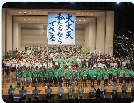
◆ 「清流文化」の創造・発信(清流の国ぎふ 総文2024プレ大会総合開会式)