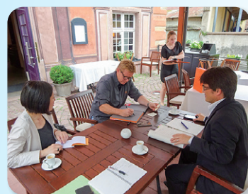
◆海外で県産品の販路を開拓 (フランス)