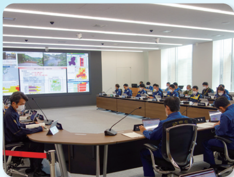
◆ 防災・危機管理体制の強化(大規模地震を想定した総合防災訓練)