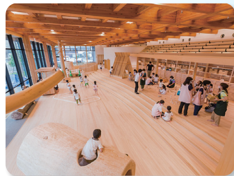
◆ 森と木からの学び『ぎふ木育』による人づくり(ぎふ木遊館)