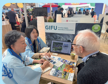
◆県内の観光地を海外でPR (イギリス)