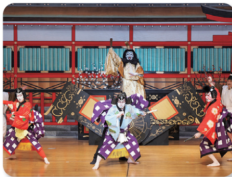
◆ 伝統文化の魅力をさらに磨き上げ未来に継承(地歌舞伎/常盤座歌舞伎保存会)