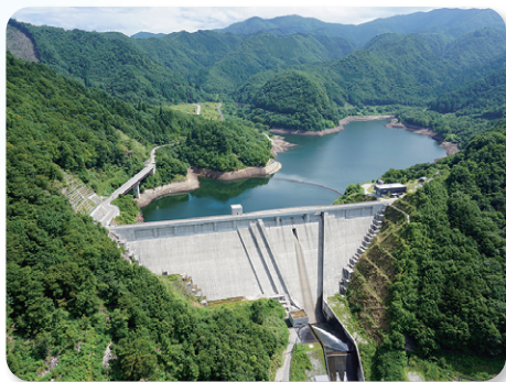
◆ ぎふの未来を支え災害に屈しない強靱な県土づくり(丹生川ダム)