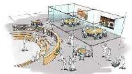
▲土岐市文化財保存活用拠点(仮称)整備事業

土岐市 総務部 行政経営課 Tel 0572-54-1145(直通) 〒509-5192 土岐市土岐津町土岐口2101 Fax 0572-54-1127 E-mail gyoukei@city.toki.lg.jp