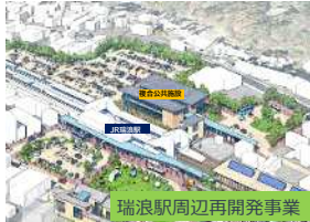
瑞浪駅周辺再開発事業

瑞浪市 総務部 企画政策課 Tel 0572-68-9740(直通) 〒509-6195 瑞浪市上平町1-1 Fax 0572-68-8749 E-mail kikaku@city.mizunami.lg.jp