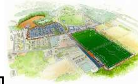
運動公園整備のイメージ(令和8年度完成予定)

可児市 市政企画部 秘書政策課・財政課 Tel 0574-62-1111(代表) 〒509-0292 可児市広見1-1 Fax 0574-62-4248 E-mail hisyoseisaku@city.kani.lg.jp zaisei@city.kani.lg.jp