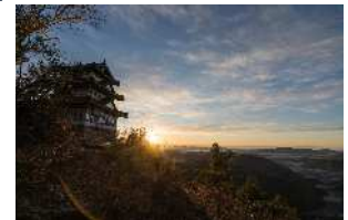
三二大桑城と日の出

大桑城は、戦国時代に守護土岐氏とその拠点として築城した美濃国最大の山城で、大河ドラマ「麒麟がくる」にも登場しました。山県市ではこの大桑城について国の史跡指定を目指した調査や、かけがえのない歴史資産を未来へつなぐための普及啓発を実施しています