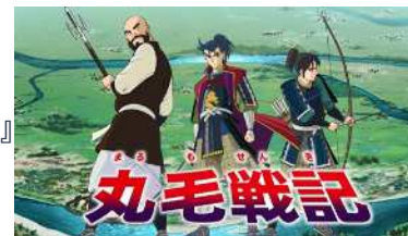
美濃福東城主・丸毛兼利を描いた町オリジナルアニメーション