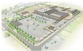
新特別支援学校のイメージ(令和7年度開校予定)

ものづくり産業をはじめとする各産業分野のバランスのとれた発展の支援や就業促進、子育て環境や教育環境の整備、住みよいまちづくりやシティプロモーション等を通じた移住・定住促進等の施策を展開します。