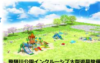
飛騨川公園インクルーシブ大型遊具整備

下呂市が目指すまちの将来像『もっと住みたい訪れたいみんなのふるさとわくわく下呂市』の実現に向け、日本三名泉として有名な下呂温泉をはじめとした豊富な観光資源のほか、市内各地域の『食・自然・文化・歴史・産業・人材』などを最大限に活かし、魅力あるまちづくりを推進することで、人口減少、少子高齢化、雇用創出など市が抱える様々な課題の解決を図ります。