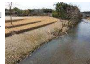
令和2年3月に完成した河川公園『とみばーく』