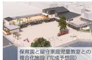
保育園と留守家庭児童教室との複合化施設(完成予想図)

留守家庭児童教室との複合化施設として保育園舎を建替え、子育て世帯が子どもを預けながら、安心して働くことができる環境をつくります。