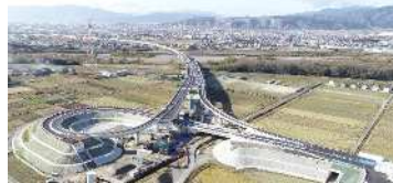
▲東海環状自動車道大野神戸IC

「人口減少の抑制を図る」、「住み続けたいと思えるまちを目指す」という2つの基本的な視点に基づき、施策をバランスよく実施していくことで、持続可能で質の高いまちづくりを進めていきます。