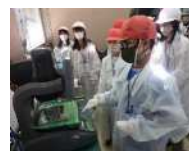
すぐ技中津川プロジェクト 市内企業の技を学び、将来に活かす!

中津川市では、ふるさと納税を活用した、企業とのパートナーシップの構築により、SDGsを推進しています。