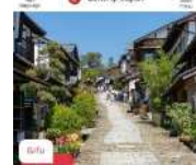
外国人観光促進事業 外国人観光客の誘客により 活気あふれる地域に!