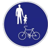
Placa autorizando ciclista na calçada