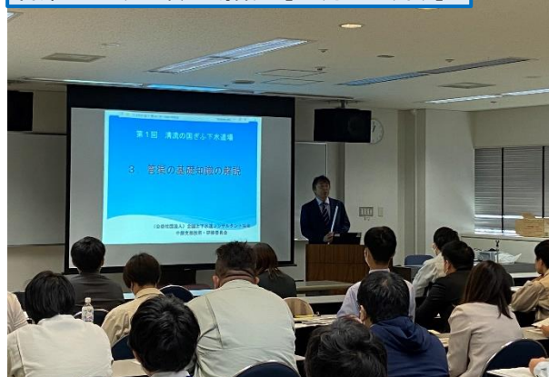
管渠の基礎知識の解説 [11月9日(木)]