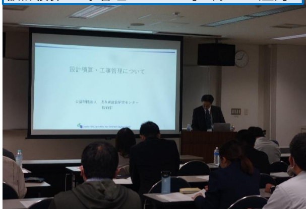
設計積算・工事管理について [11月10日(金)]