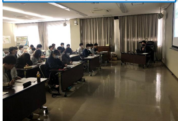
下水道行政の今後の方向性について [11月29日(水)]