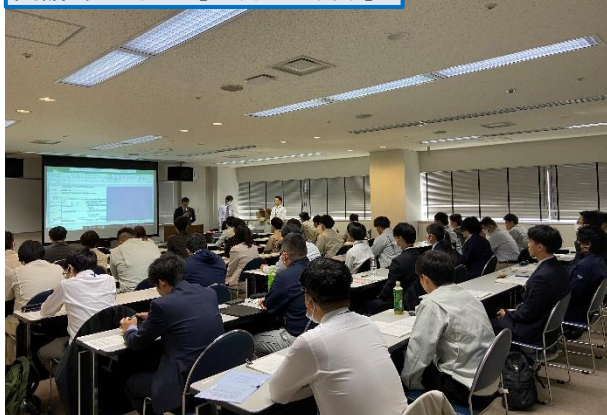
開講あいさつ [11月9日(木)]