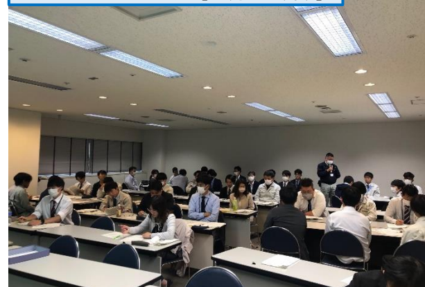
グループワーキング [11月9日(木)]