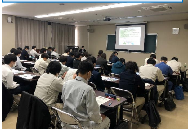
処理施設の基礎知識の解説 [11月29日(水)]