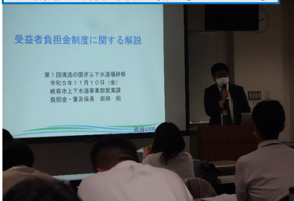
受益者負担金制度に関する解説 [11月10日(金)]