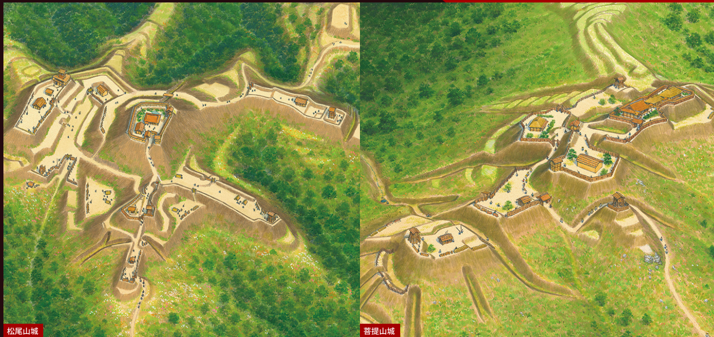
復元イラスト：香川元太郎