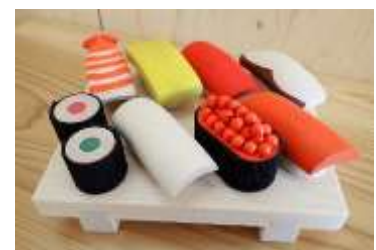
木のおもちゃ 「お寿司セット」