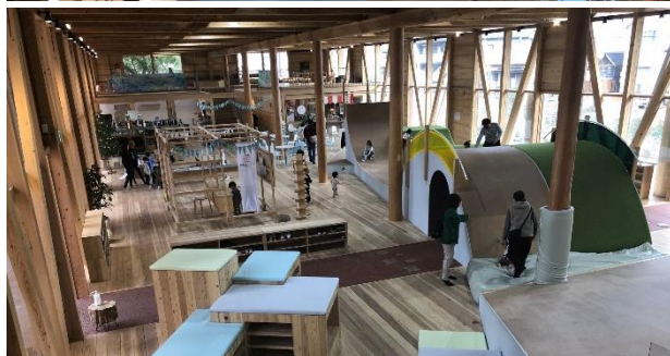
写真:KAKAMIGAHARA PARK BRIDGE