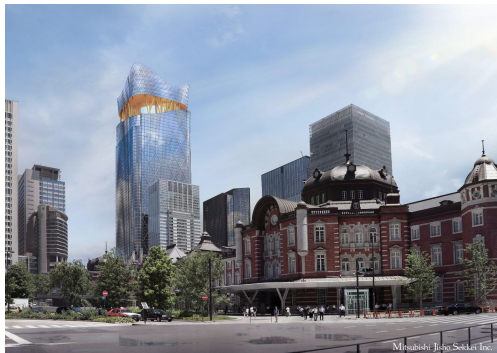
▲完成時のTOKYO TORCH全景 (東京駅丸の内側より)