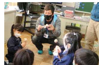
生活科支援 (昔の遊び)