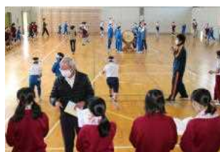
伝統芸能 (地域の踊り)