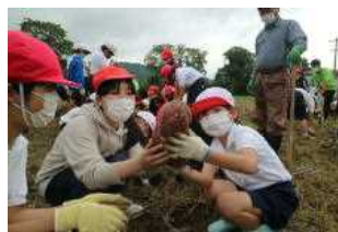
栽培活動 (サツマイモ)