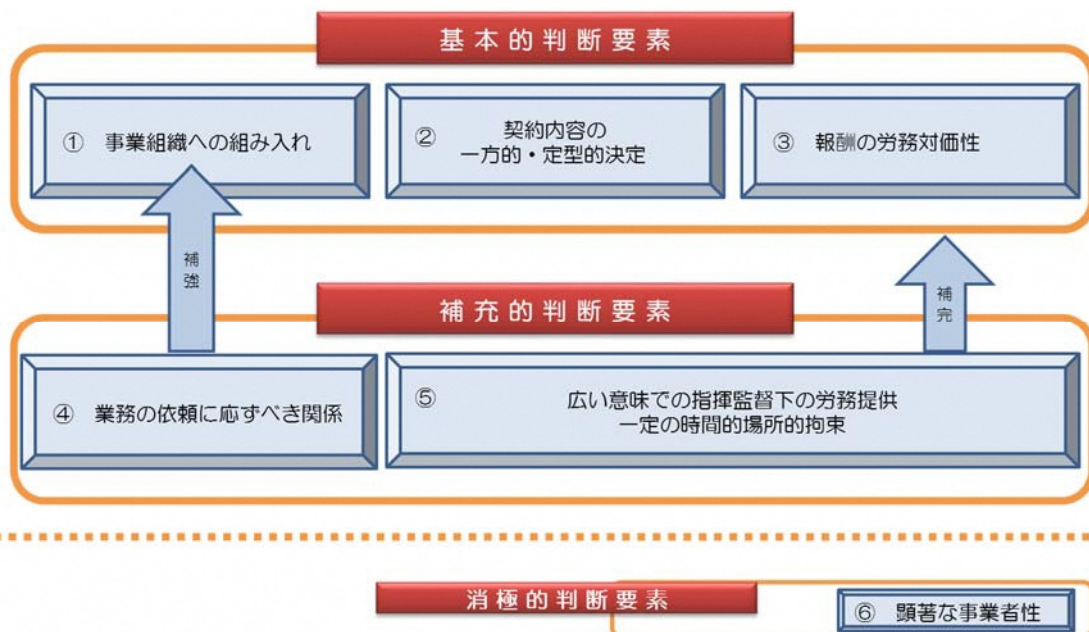
(図3：各判断要素の関係（労働組合法）)

※労使関係法研究会報告書（労働組合法上の労働者性の判断基準について）（平成23年7月）で示された判断要素に基づく。