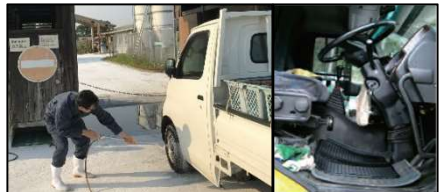
車両はタイヤだけでなく、 泥よけの内側まで消毒 し、 フロアマットの交換 や ペダル等車内も消毒