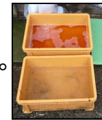
推奨される踏込消毒槽の設置方法！