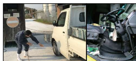
車両はタイヤだけでなく、 泥よけの内側まで消毒 し、 フロアマットの交換やペダル等車内も消毒