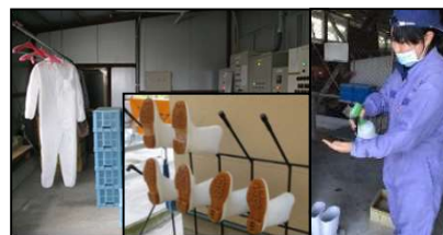
専用の服や靴の使用、手指消毒