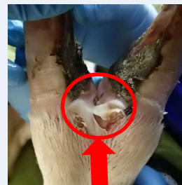
水疱が破れている