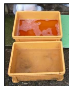
！推奨される踏込消毒槽の設置方法！