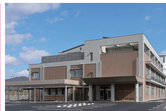
岐阜県障がい者総合就労支援センター