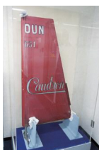
コードロン・シムーン機のラダー（実物）