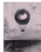
オディロン・ルドン (1840年-1916年)「エドガー・ボーに」I. 眼は奇妙な気球のように無限に向かう」岐阜県美術館蔵

【講師】 岐阜県美術館教育普及係 【日時】 9月2日(土) ①10:30～12:00 ②13:30～15:00 【定員】 各回30名 【対象】 小学生から大人まで (小学校4年生以下は保護者同伴)