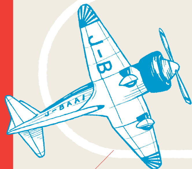
1936 神風号 Kamikaze