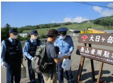
登山者に対する啓発活動