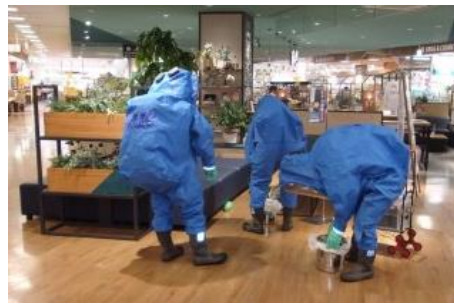
毒物散布を想定した除去訓練（ショッピングモール内）