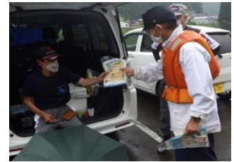
水難事故防止広報活動