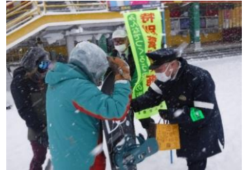
盗難防止広報活動