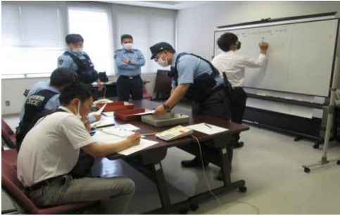
大規模災害を想定した図上訓練