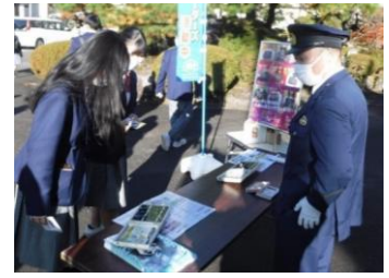
薬物乱用防止啓発活動