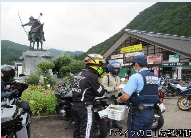
「バイクの日」広報活動