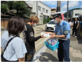
観光客に対する啓発活動