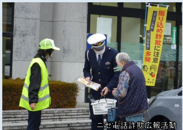
二七電話詐欺広報活動