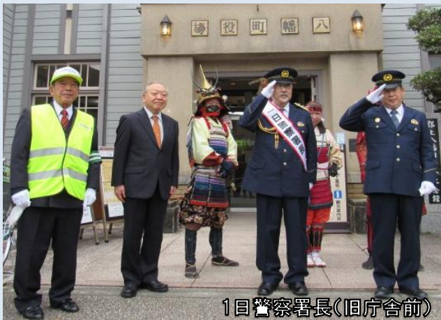
1回警察署長(旧庁舎前)