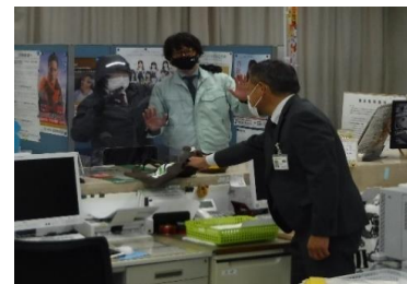
強盗事件想定訓練