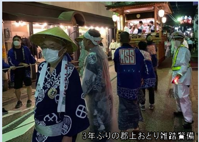
3年ぶりの郡上おどり雑踏警備