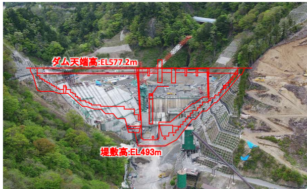
① ダムサイト状況(下流上空より望む)