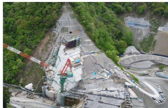
② ダムサイト右岸状況(左岸上空より望む)