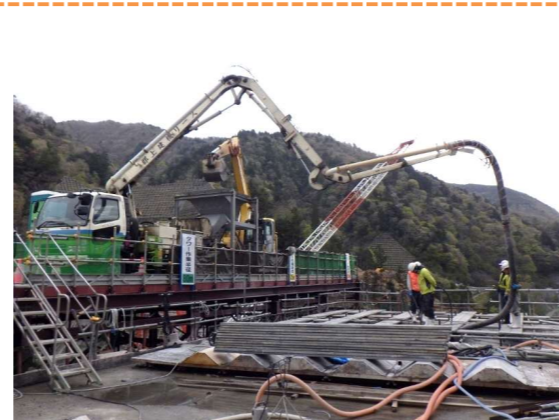
コンクリートポンプ打設(造成アバット部) (EL572.50m)