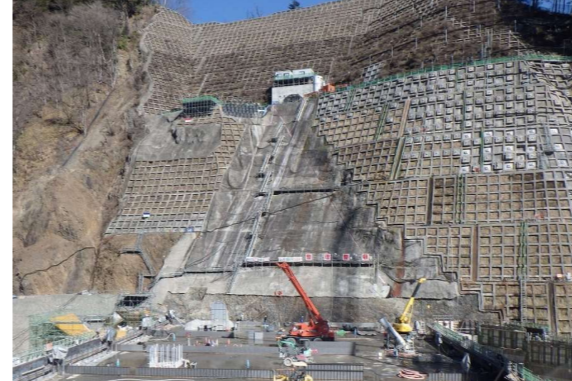
③ ダムサイト左岸状況(右岸より望む)