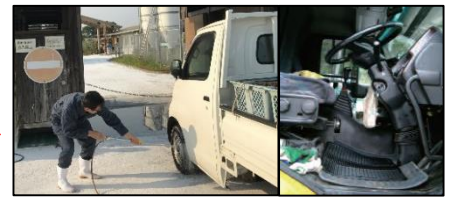
車両はタイヤだけでなく、 泥よけの内側まで消毒 し、 フロアマットの交換 や ペダル等車内も消毒