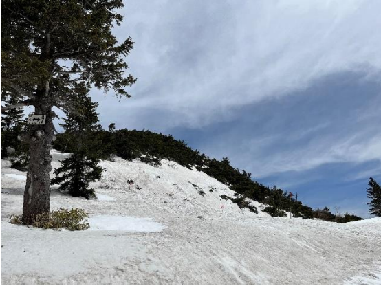
ロープウェイ～西穂高山荘前 2023/4/29