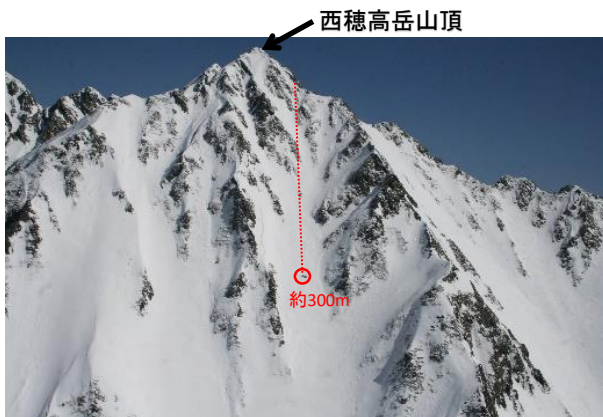
西穂高岳山頂滑落現場 2020/3/19