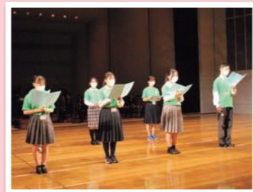
令和4年度岐阜県高等学校総合文化祭