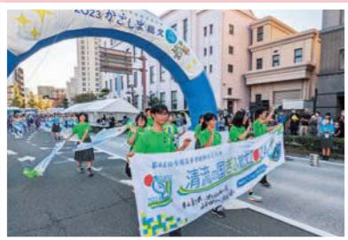
2023かごしま総文プレ大会パレード

また、とうきょう総文2022本大会（令和4年7月31日・8月1日）のパレードや、2023かごしま総文プレ大会（令和4年10月23日・11月3日）の総合開会式やパレードに参加しました。