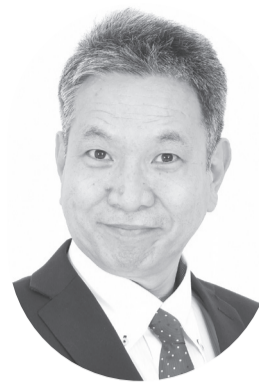
日本維新の会 公認