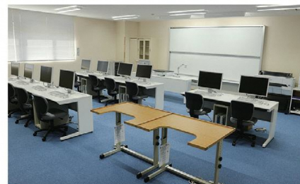
Webデザイン科実習室