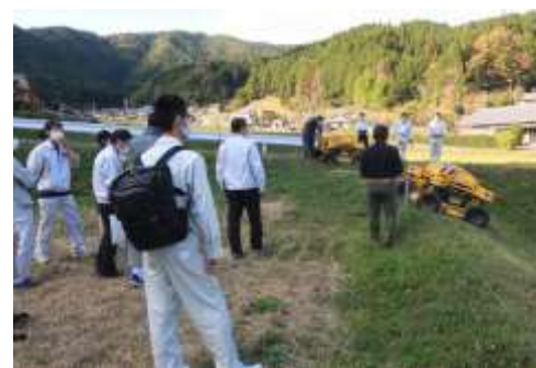
土地利型専門員研修 (スマート農業専門員研修)