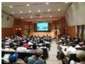
スマート農業サミット