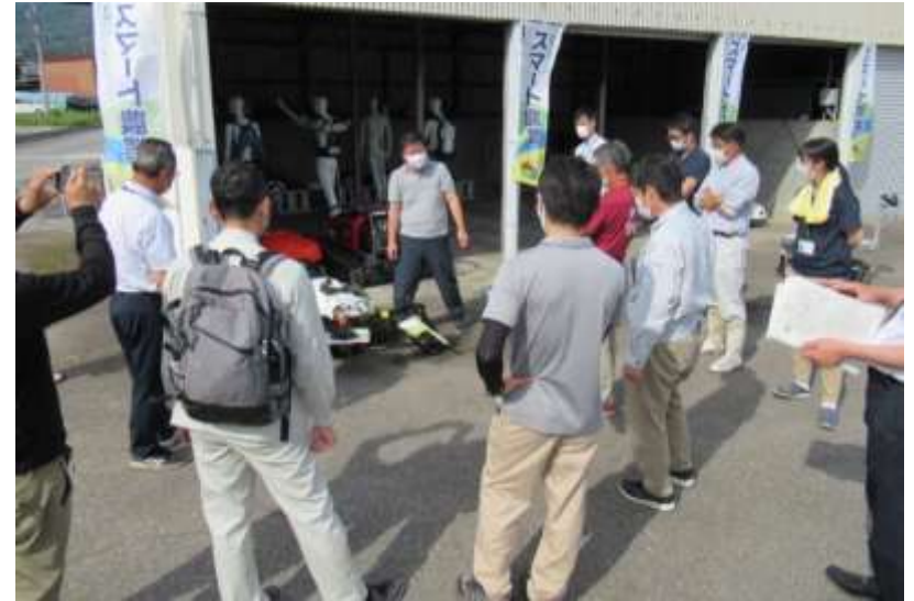
6月11日:スマート農業推進センター全県拡大セミナー