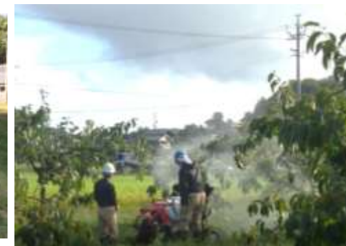
農業用無人車(R150)実証 (産地の戦略づくり支援)