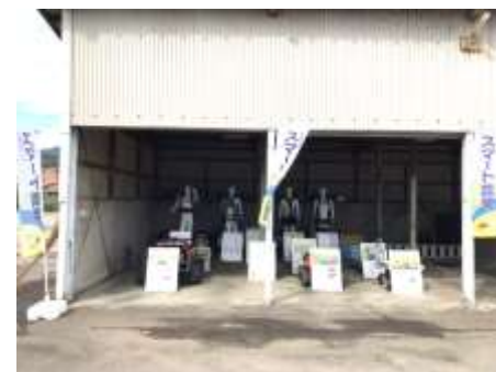
中山間農業研究所での展示 (拠点機能の全県拡大)