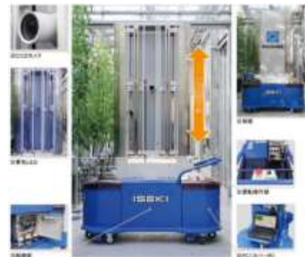
クロロフィル蛍光画像計測装置 (モデル温室に整備)