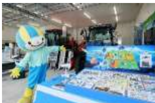
スマート農業推進センター (展示室)