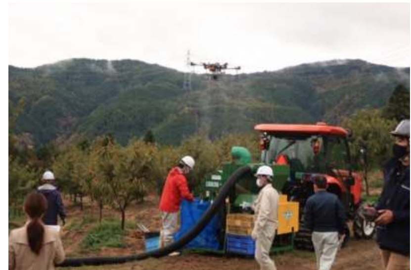
11月7日:くり産地スマート農業実演会