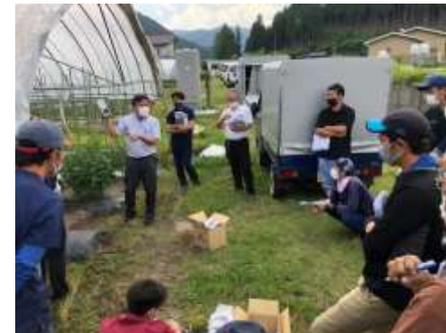
夏秋トマト研修会 (データ駆動型)