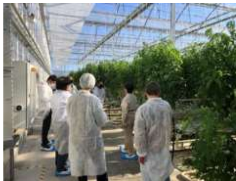
冬春トマト研修会 (データ駆動型)

・カワウ飛来地におけるテグス張り、生息状況調査及びドライアイスを用いた卵孵化抑制技術の試験を実施。