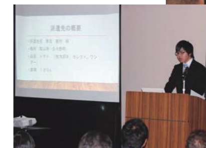
<学習成果発表会の様子>