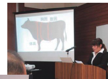
<卒業論文発表会の様子>