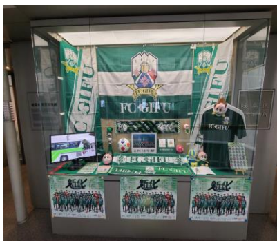
(都道府県会館内各東京事務所前ショーウィンドー)